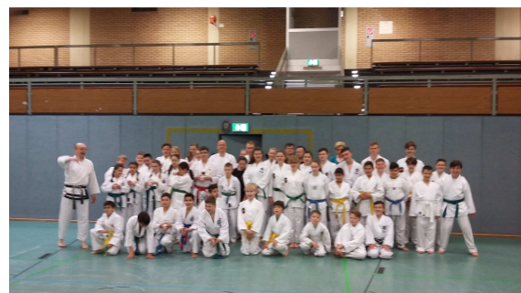
3 Tage im Trainingscamp in Rheine