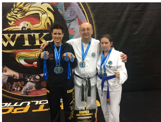
Wir bei der WM in Italien