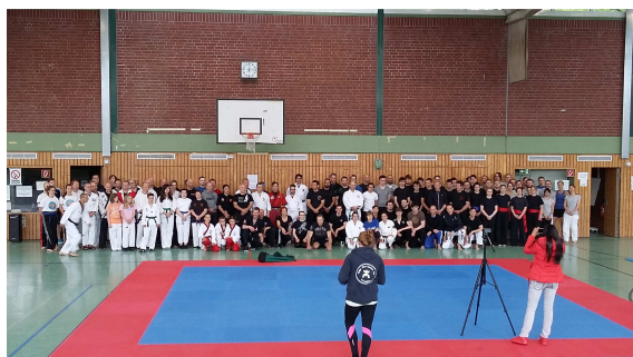
Pfingsten beim internationalen Lehrgang in Dortmund