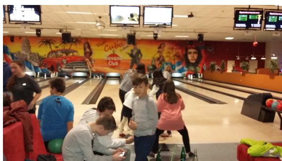
Unsere Weihnachtsfeier im Bolzano