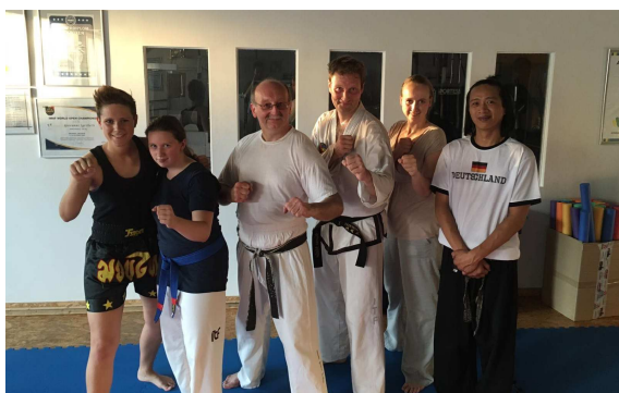
In Gevelsberg zur Vorbereitung auf die WM in Italien