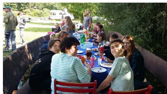
Unsere Sommer-Party auf dem Reuschenberg