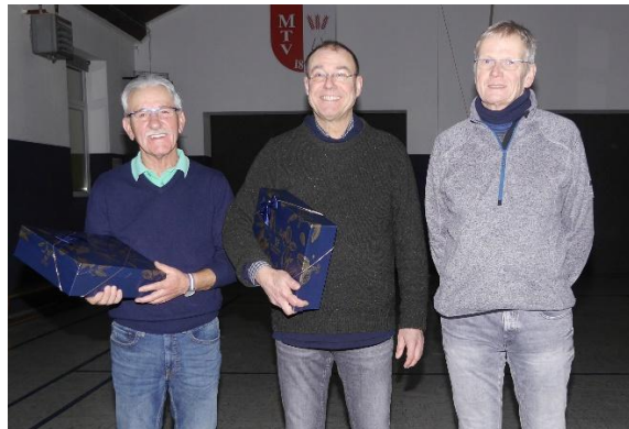
Die 3 Erstplatzierten